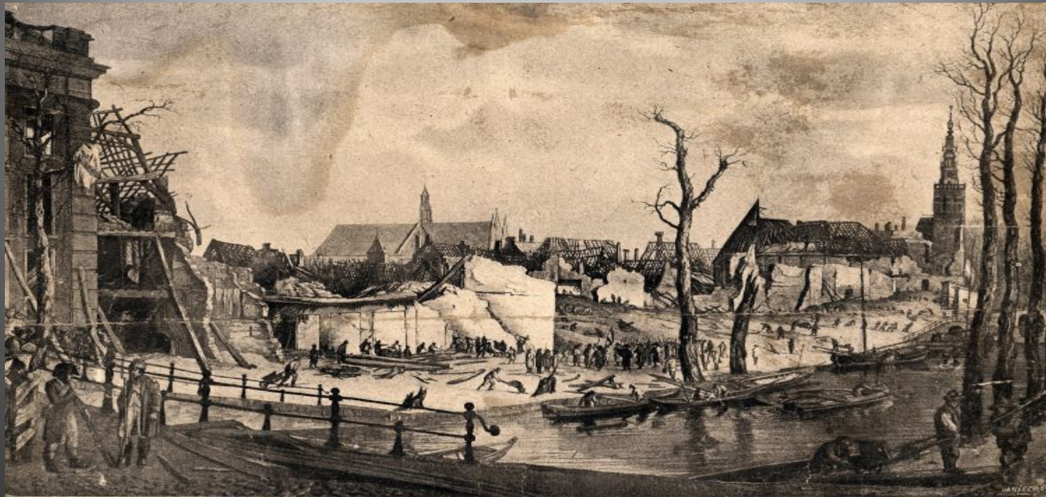
Ruïnen binnen de stad Leiden door het springen van een kruischip (12 Januari 1672). Naar een tekening uit de Braddweer-collectie H. G. Bon G.Dz. Amsterdam.