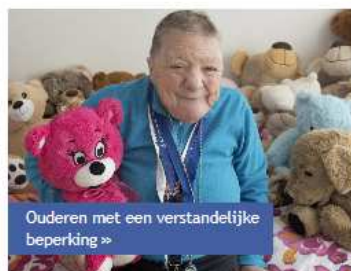
Ouderen met een verstandelijke beperking »

Gerrie Knetemannlaan heeft vier kleine woongroepen voor ouderen met een verstandelijke beperking die het gezellig vinden om samen met burens te eten, te koken of andere leuke dingen te doen. Er zijn ook 12 individuele appartementen voor mensen die zelfstandig willen wonen met begeleiding op afstand.