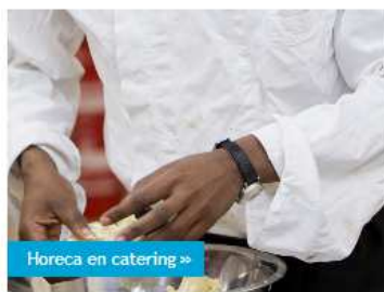
Horeca en catering »

Werkt u graag met eten en houdt u van bedienen? Dan is werken in de horeca en catering echt wat voor u! In de Gerrie Knetemannlaan kunt u koffie en thee zetten, de lunch verzorgen, boodschappen doen, schoonmaken, werken in de speelkeuken, enzovoort.