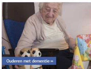
Ouderen met dementie »

Gerrie Knetemannlaan heeft zes kleine woongroepen voor ouderen met dementie. In deze groepen leeft u zoveel mogelijk 'als thuis'. U kookt en eet samen, en kunt meedoen aan gezamenlijke activiteiten. Met vijf medebewoners vormt u een huishouden.