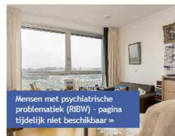
Mensen met psychiatrische problematiek (RIBW) - pagina tijdelijk niet beschikbaar »

Ouderen met een verstandelijke beperking »