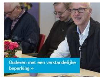
Ouderen met een verstandelijke beperking »

Speciaal voor ouderen met een verstandelijke beperking is in de Gerrie Knetemannlaan een groep voor dagbesteding. Hier kunt u in een rustig tempo meedoen aan activiteiten die passen bij uw interesses.