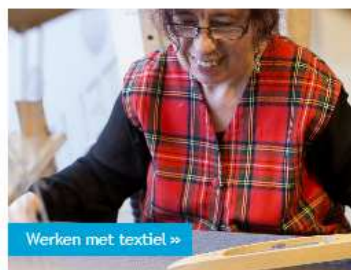
Werken met textiel »

Werken in de horeca - Gerrie Knetemannlaan »