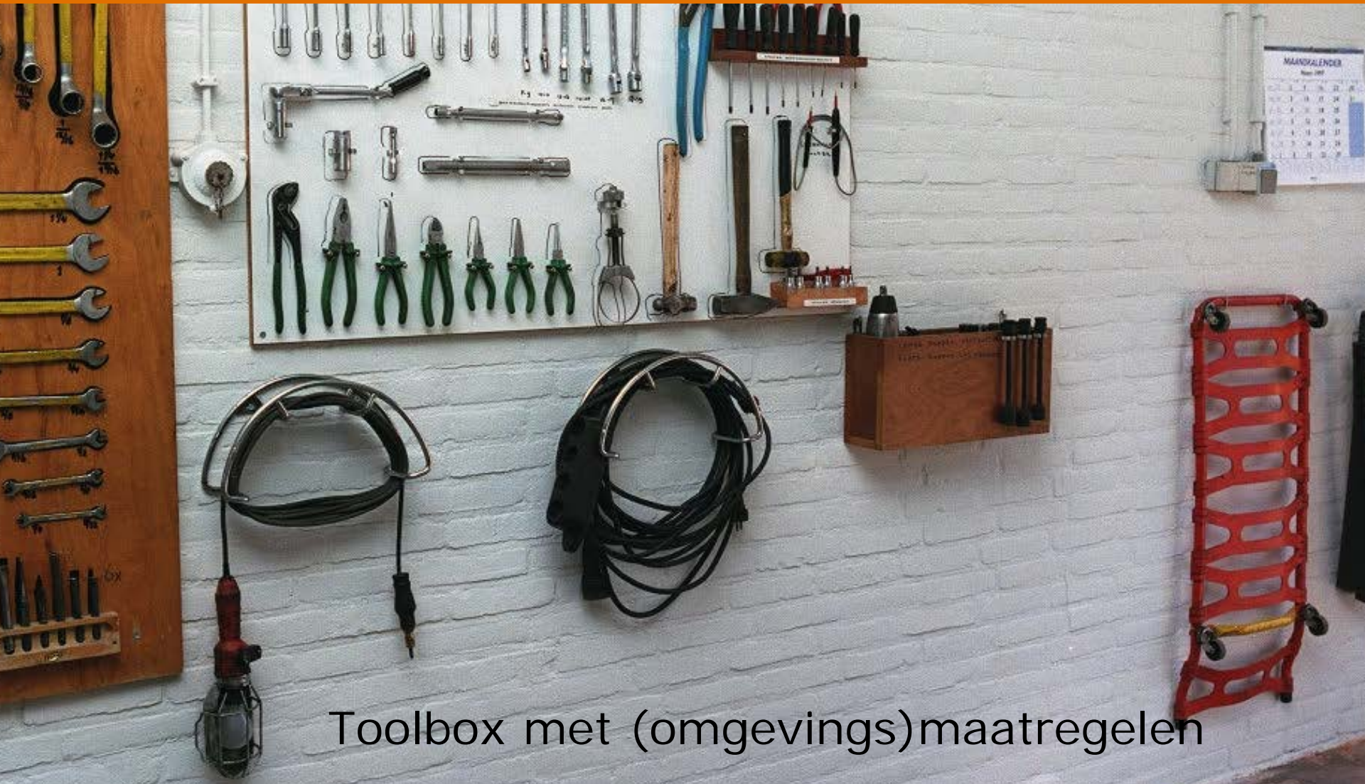
Toolbox met (omgevings)maatregelen