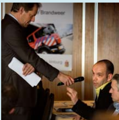
De gasten krijgen volop de kans om mee te praten, en daar maken ze gebruik van!