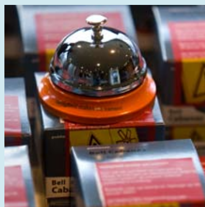
De bel als symbool om mensen bij elkaar te brengen en samen actief externe veiligheid op te pakken.