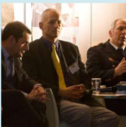
Panelgesprek met een vertegenwoordiging vanuit de bestuurlijke begeleidingsgroep.