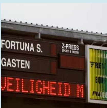
Op het scorebord: Veiligheid maken we samen!