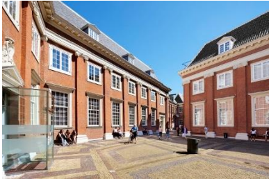
Binnenplaats Amsterdam Museum.

Na al die verhalen over en perspectieven op de Gouden Koets heeft de bezoeker de gelegenheid de koets in alle rust buiten te bekijken. Het rijtuig staat opgesteld in een speciale glazen behuizing waar bezoekers omheen kunnen lopen en zo de koets van alle kanten kunnen bezichtigen. Middels de audiotour wordt door diverse personen toegelicht wat er precies op de koets te zien is en hoe dat kan worden geïnterpreteerd.