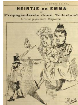
Spotprent Heintje en Emma in De Roode Duivel, okt 1894