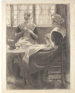
'Twee zittende weesmeisjes met naaiwerk', Van der Waay Collectie Amsterdam Museum.

In deze zaal draait het ook om de makers van de Gouden Koets. Een indringende fotoserie toont de ambachtslieden die de koets maakten. Twaalf mannen werkten in de fabriek Spyker bijna twee jaar lang aan de koets. In de audiotour maakt de bezoeker kennis met een van hen, bankwerker C.H. Bos. De bezoeker ontmoet via prenten en schilderijen de dames van Tesselschade, Arbeid Adelt en de meisjes uit het burgerweeshuis, het gebouw waar nu het Amsterdam Museum is gevestigd. Samen waren zij verantwoordelijk voor het borduurwerk van het gehele interieur van de koets. Ruim 15 miljoen steekjes. Hoewel de koets voor de eerste vrouw op de troon bestemd was, waren zij de enige vrouwen die een ambachtelijke bijdrage leverden. Ook wordt in de zaal gedetailleerd aandacht besteed aan het restauratieproces van de Gouden Koets in de afgelopen jaren.