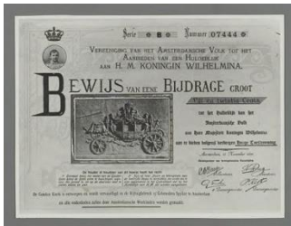
Bewijs van bijdrage, Stadsarchief Amsterdam

Het idee voor de Gouden Koets ontstond in een stad in verandering. De tentoonstelling neemt de bezoeker allereerst mee naar het Amsterdam van het eind van de negentiende eeuw, dat na een lange periode van stilstand in razend tempo uitgroeide tot een moderne en zelfbewuste hoofdstad. Waar tot voor kort stadsmuren hadden gestaan verrezen treinstations, fabrieken, luxe hotels en nieuwe wijken. In dertig jaar tijd verdubbelde het aantal inwoners, mede door de komst van grote aantallen plattelandsbewoners. Wat deelden de Amsterdammers nog met elkaar? Vrouwen en arbeiders streefden naar een volwaardige positie, jongeren zochten hun eigen weg en ook in de kerken was het onrustig. De behoefte aan een verbindend symbool groeide: Oranje. Koning Willem III (1817-1890) bracht echter weinig mensen in vervoering. Zijn jonge dochter, koningin Wilhelmina (1880-1962), sprak meer tot verbeelding. Tijdens de acht jaar durende aanloop naar haar meerderjarigheid en inhuldiging groeide de wens haar met de hele stad een cadeau te geven.