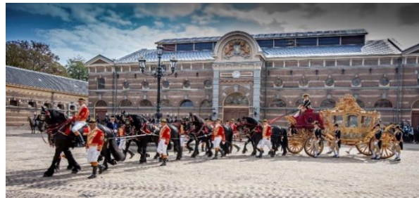
De Gouden Koets.

De Gouden Koets wordt getoond in een glazen behuizing op de grote binnenplaats van het Amsterdam Museum. Bezoekers kunnen de gerestaureerde koets in alle rust van heel dichtbij bekijken. In zes museumzalen rondom de binnenplaats, alle met zicht op de Gouden Koets, worden uiteenlopende verhalen uitgelicht. Honderden cultuurhistorische objecten, schilderijen, Oranjesnuisterijen, kledingstukken, spotprenten, foto's en bewegende beelden geven een veelzijdig beeld van de geschiedenis en het gebruik van de Gouden Koets en de discussies uit verleden en heden over dit iconische voertuig.