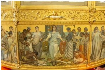
Paneel 'Hulde der Koloniën'

Op de koets staan verschillende verwijzingen naar de koloniën, waaronder het veelbesproken paneel 'Hulde der Koloniën' geschilderd door Nicolaas van der Waay. Om die verwijzingen en het beeld dat destijds over de koloniën bestond te begrijpen wordt in de tentoonstelling De Gouden Koets gekeken naar de koloniale tentoonstelling uit 1883 op het Museumplein. Zo'n anderhalf miljoen Nederlanders maakten op deze Wereldtentoonstelling kennis met de koloniën. De bedenkers en makers van de Gouden Koets waren daar ook aanwezig. De broers Spijker stonden er met rijtuigen en Nicolaas van der Waay schilderde allegorische portretten voor een van de paviljoens. Dit werpt de vraag op in hoeverre zij de verbeelding van de koloniën op de Gouden Koets baseerden op de Wereldtentoonstelling van 1883. In de tentoonstelling De Gouden Koets wordt een veelzijdige selectie van wat de broers Spijker en Van der Waay gezien moeten hebben getoond: een overdaad aan producten, grondstoffen en cultuuruitingen. De ambitie van de organisatoren: 'moderne Westerse beschaving brengen in de koloniale wildernis, en de koloniale wildernis laten zien aan het moderne beschaafde publiek in Amsterdam'. Daarom werden ook koninkrijksgenoten uit Indië en Suriname tentoongesteld. Kunstenaar Nelson Carrilho, nazaat van een van de mensen uit Suriname die gepresenteerd werd op de wereldtentoonstelling, reflecteert met zijn werk op de koloniale tentoonstelling en het kolonialisme.