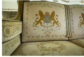
Details Gouden Koets

In deze zaal draait het ook om de makers van de Gouden Koets. Een indringende fotoserie toont de ambachtslieden die de koets maakten. Twaalf mannen werkten in de fabriek Spyker bijna twee jaar lang aan de koets. In de audiotour maakt de bezoeker kennis met een van hen, bankwerker C.H. Bos. De bezoeker ontmoet via prenten en schilderijen de dames van Tesselschade, Arbeid Adelt en de meisjes uit het burgerweeshuis, het gebouw waar nu het Amsterdam Museum is gevestigd. Samen waren zij verantwoordelijk voor het borduurwerk van het gehele interieur van de koets. Ruim 15 miljoen steekjes. Hoewel de koets voor de eerste vrouw op de troon bestemd was, waren zij de enige vrouwen die een ambachtelijke bijdrage leverden. Ook wordt in de zaal gedetailleerd aandacht besteed aan het restauratieproces van de Gouden Koets in de afgelopen jaren.