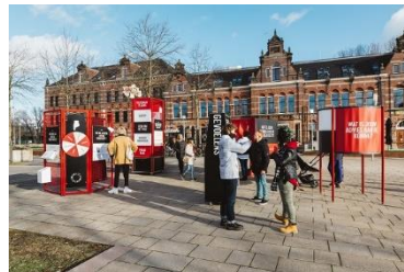
'Mobiele onderzoekinstallatie Gouden Koets.'