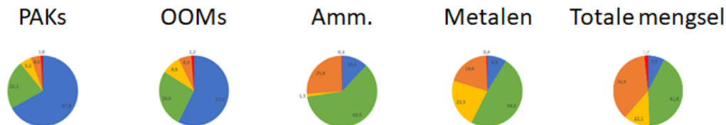
Figuur 2. Analyse van de indeling van Nederlandse oppervlaktewateren in chemische verontreinigingsklassen voor mengsels (t.a.v. directe effecten van blootstelling aan mengsels op eindpunten zoals groei en reproductie van soorten) met de monitoringdata van Nederland, met data voor de periode 2013-2018. De indeling is gemaakt voor een aantal afzonderlijke stofgroepen (polycyclische aromatische koolwaterstoffen, PAKs, overige organische microverontreinigingen, OOMs, ammonium/ammoniak en metalen, en voor gegevens over de totale mengsels.