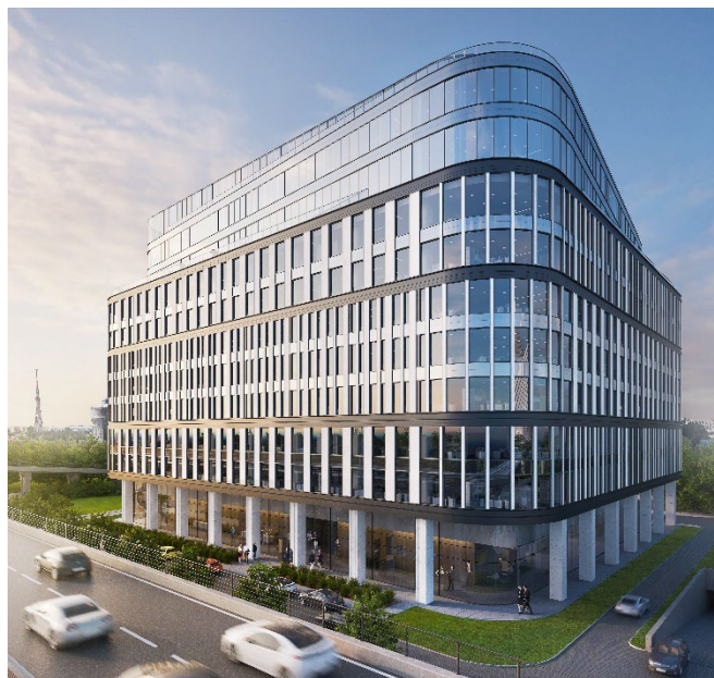
Vizualizace projektu ARC

Rumunsko je jedním z klíčových trhů skupiny PPF. Mimo realitní a developerský sektor je tato přední středoevropská investiční společnost významným hráčem v rumunském mediálním průmyslu, kde provozuje nejsledovanější komerční televizní kanál PRO-TV.