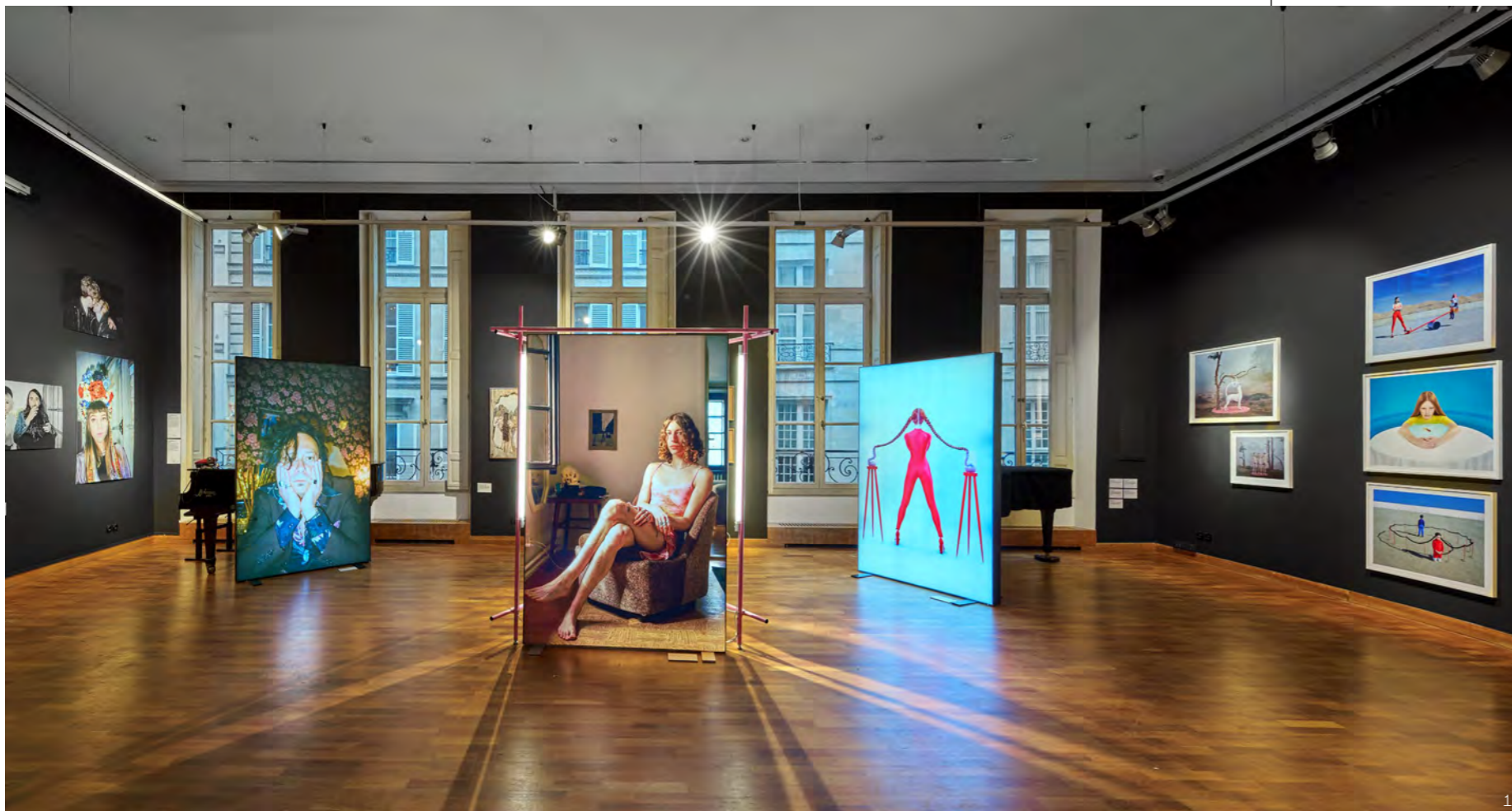
1 Výstava Radost a skrýš v Českém centru Paříž