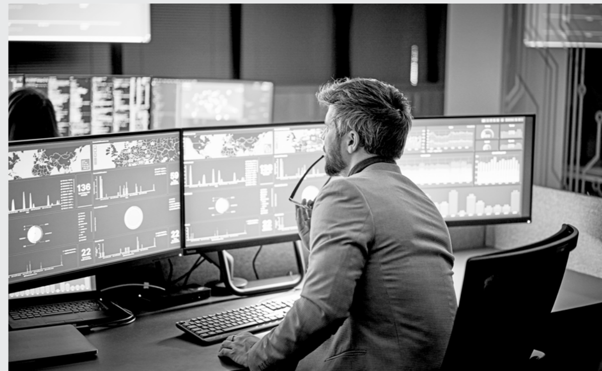
Bezpečnostní dohledové centrum (Security Operations Centre) společnosti CETIN v Praze

zranitelností až po reakci na incidenty zákazníci získávají přístup k expertize a technologiím, které by bylo obtížné si samostatně vybudovat.