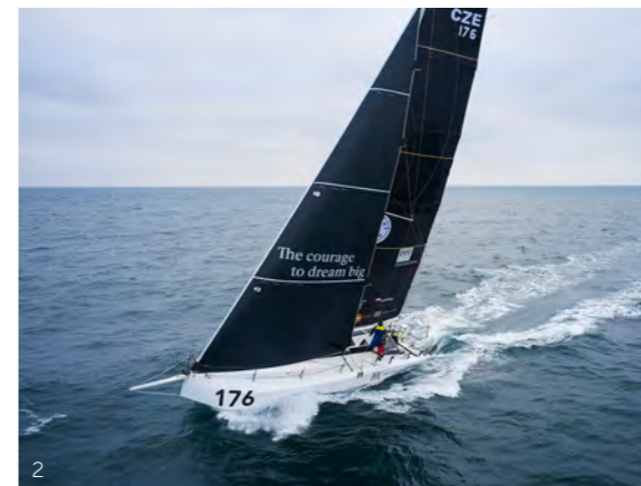
2 Jachtař Milan Kolářek během závodu třídy Class 40