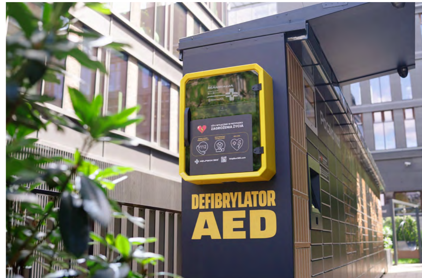
Společnost InPost podpořila instalaci AED defibrilátorů s 24/7 přístupem

V České republice se televize Nova spojila s neziskovou organizací Patron dětí a založila novou charitativní sbírku.