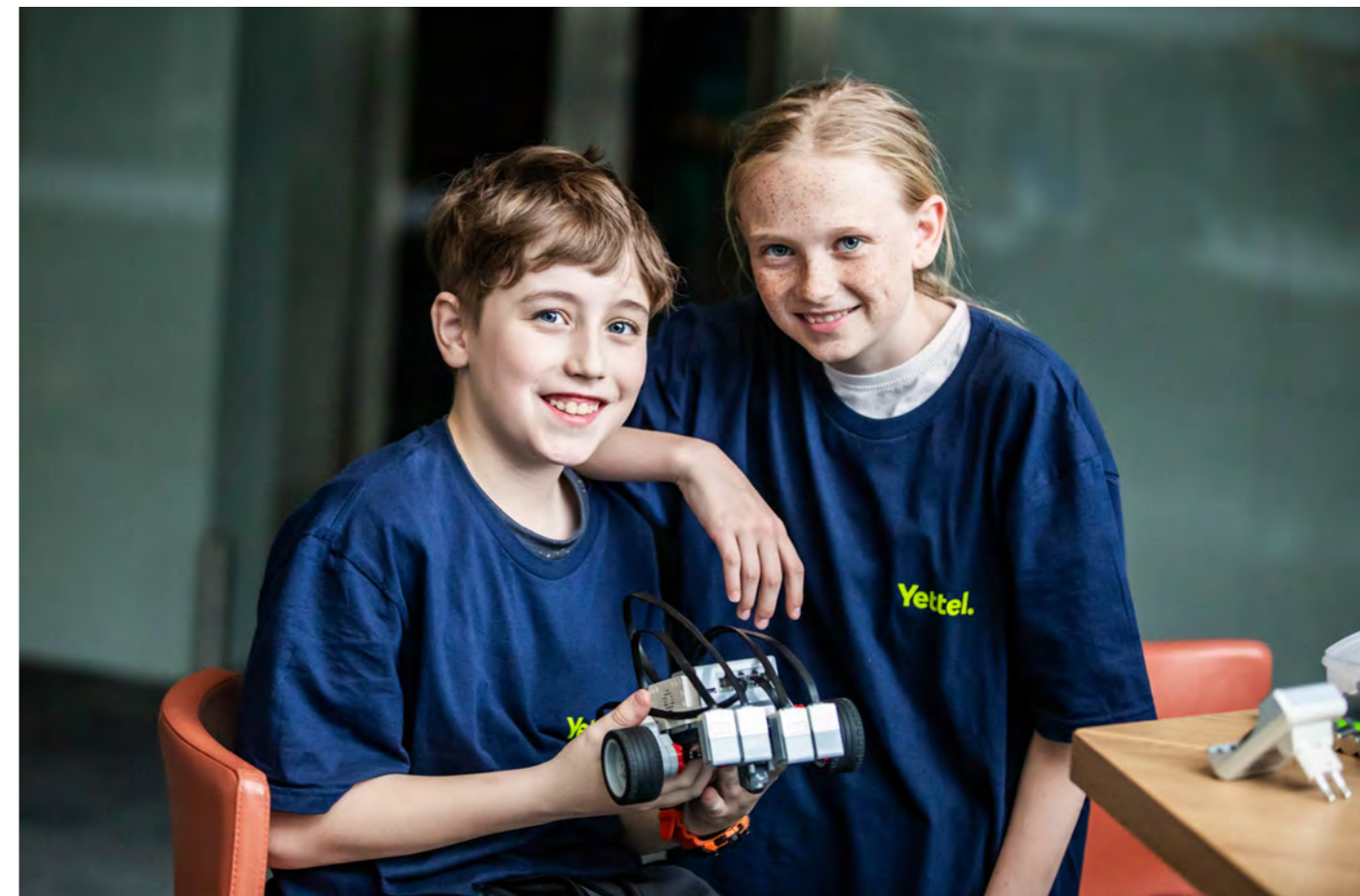
Mladí inovátoři na soutěži ProSuli v robotice, kterou pořádá Yettel Hungary

Společnosti poskytující finanční služby se zaměřují zejména na podporu finanční gramotnosti a odpovědné správy osobních financí. Tyto iniciativy jsou realizovány na mezinárodní úrovni ve spolupráci s místními organizacemi, vzdělávacími institucemi a dalšími partnery a zahrnují finanční i materiální podporu, workshopy a produkci a distribuci publikací, videí a digitálních aplikací.