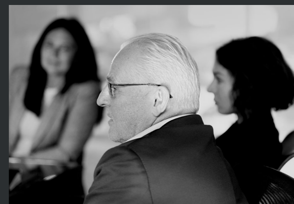
Jednání akcionářů a vrcholového vedení skupiny PPF v sídle společnosti.