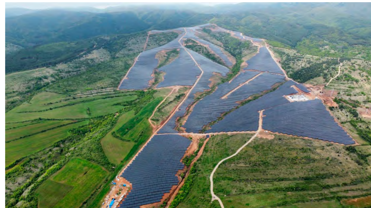
Verila, největší solární elektrárna v Bulharsku, dodává elektřinu pro CETIN a Yettel

Třetí ročník Zeleného týdne, který se vloni uskutečnil v šesti zemích, se zaměřil na udržitelnost. Tematickým vysíláním přiblížil divákům oblasti dopravy, recyklace, ener-