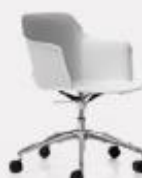
5 RACES TREND L70/43 P70/43 H97/80