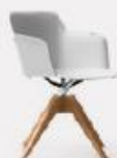
4 WOODEN RACES L70/43 P70/43 H 97/80