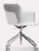
4 RACES LEGGERA L70/43 P70/43 H 97/80