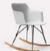
DONDOLO L58/43 P53/43 H75/42