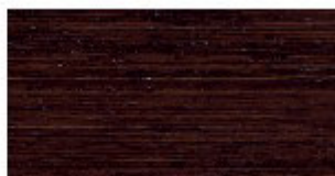
E1 ROVERE MOKA