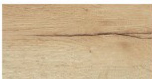
E2 ROVERE NATURE