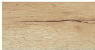
E2 ROVERE NATURE