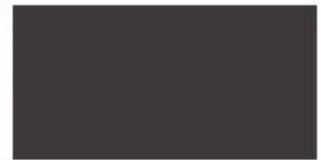
E3 ROVERE NERO