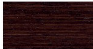
E1 ROVERE MOKA