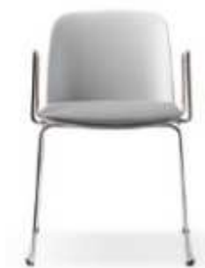
Braccioli in filo