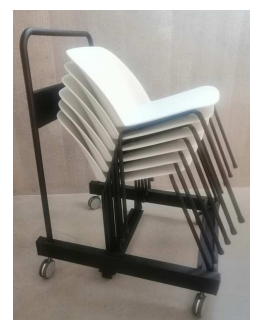
Carrello porta sedie