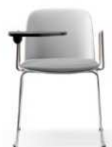
Braccioli in filo e tavoletta