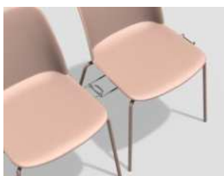
Gancio di unione a scomparsa