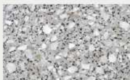
GRIGIO PERLA 172