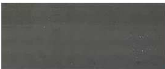
V0 FERRO TRASPARENTE (MATT)