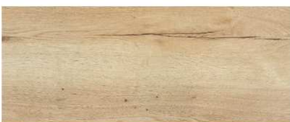
HR ROVERE NATURALE