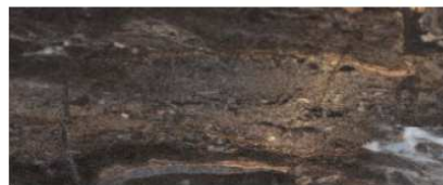
N6 EFFETTO MARMO