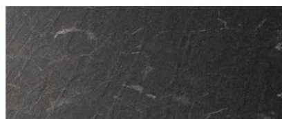
HM NERO EFFETTO MARMO

Piano in AGGLOMERATO TERRAZZO nei colori: