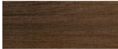
N2 MOKA LARIX