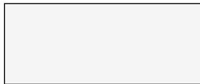
HB BIANCO / NERO