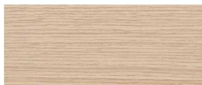
N4 ROVERE NATURALE