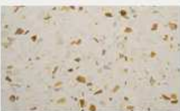
CA D'OR 140

Piano in AGGLOMERATO TERRAZZO nei colori: