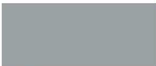
V4 MORNING (MATT)

Il metallo è verniciato a polveri epossidiche nei colori bianco o nero o nei colori-: