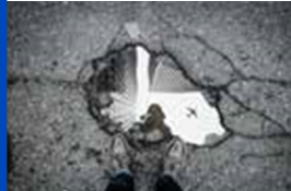
Agua en un bache