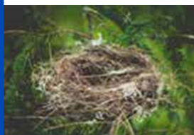
Un nido en un árbol o en un edificio