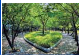
Césped en un jardín