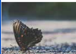
Insectos en el suelo