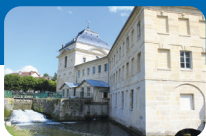
Pavillon de Manse