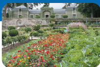
Potager des Princes