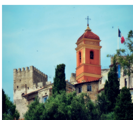
Vieux Village de Roquebrune-Cap-Martin