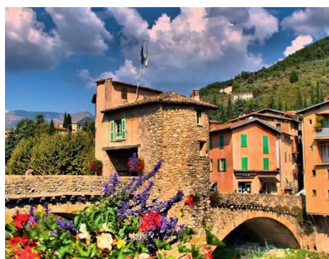
Pont Vieux de Sospel