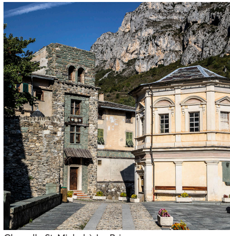
Chapelle St-Michel à La Brigue