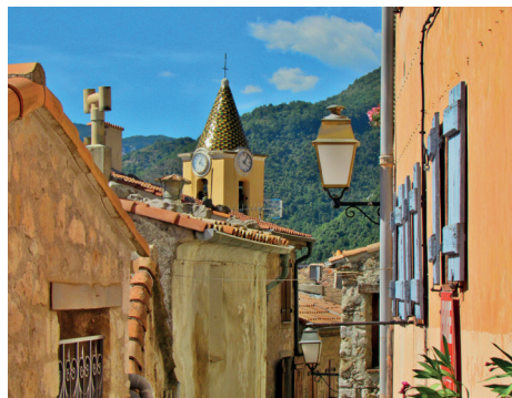
Ruelle de Sainte-Agnès