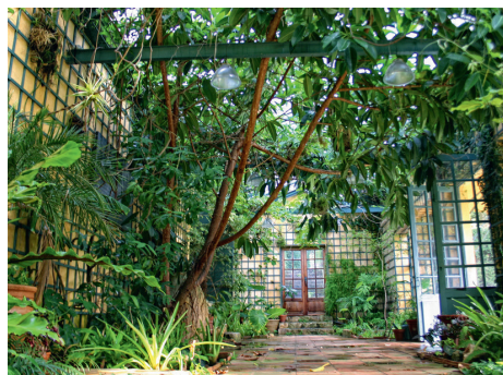
Jardin Serre de la Madone