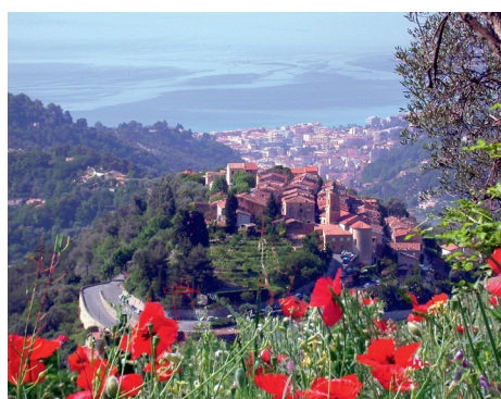
Panorama du Village de Castellar