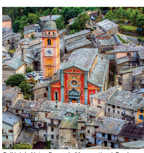
Collégiale Notre-Dame de l'Assomption à Tende