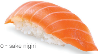
220 - sake nigiri