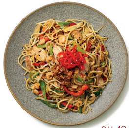
plu 40 yaki soba

soba/ramen noodles | ince, yumurtalı buğday eriştəsi rice noodles | ince ve yassı, yumurtasız pirinç eriştəsi