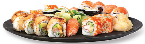
271 - waga set 2