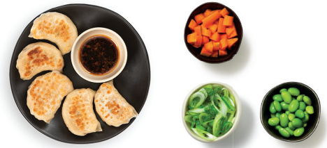
plu 100 chicken gyoza

fried served with a dipping sauce 99 | duck 5 pieces 38.00 ₺ 199 | duck 3 pieces 30.00 ₺ 102 | ebi 5 pieces 38.00 ₺ 1102 | ebi 3 pieces 30.00 ₺