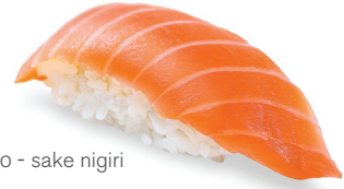
220 - sake nigiri