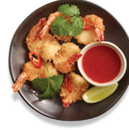
plu 103 ebi katsu