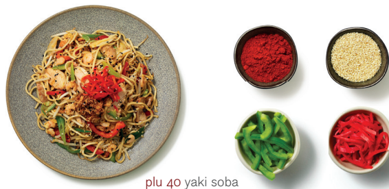
plu 40 yaki soba

rice noodles | flat, thin noodles without egg or wheat