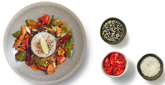
plu 87 firecracker chicken