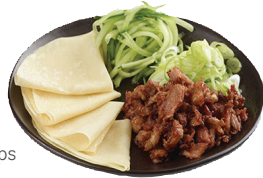
plu 112 duck wraps

120 | bang bang cauliflower (vg) 30.00 ₺ crispy wok-fried cauliflower coated in firecracker sauce mixed with red and spring onions, garnished with fresh ginger and coriander