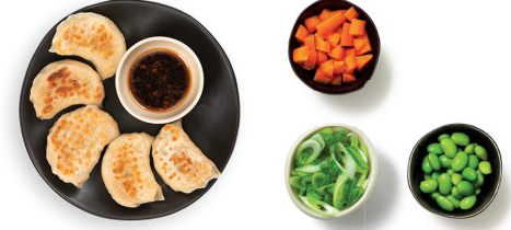
plu 100 chicken gyoza