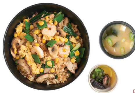
plu 77 cha han