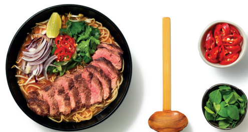
plu 24 chilli steak ramen

34 | chilli prawn + kimchee ramen ? new 71.00 ₺ marinated tail-on prawns, kimchee and beansprouts on top of noodles in a spicy vegetable broth. finished with spring onions, fresh lime and coriander