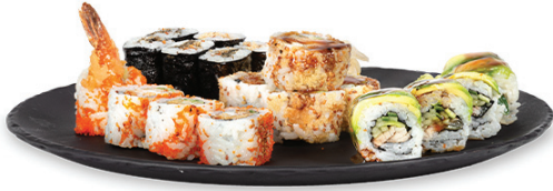
273 - waga set 3