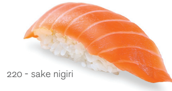
220 - sake nigiri