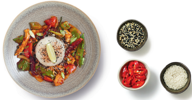
plu 87 firecracker chicken