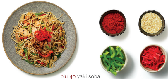
plu 40 yaki soba

rice noodles | ince ve yassı, yumurtasız pirinç eriştisi