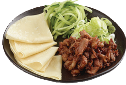
plu 112 duck wraps