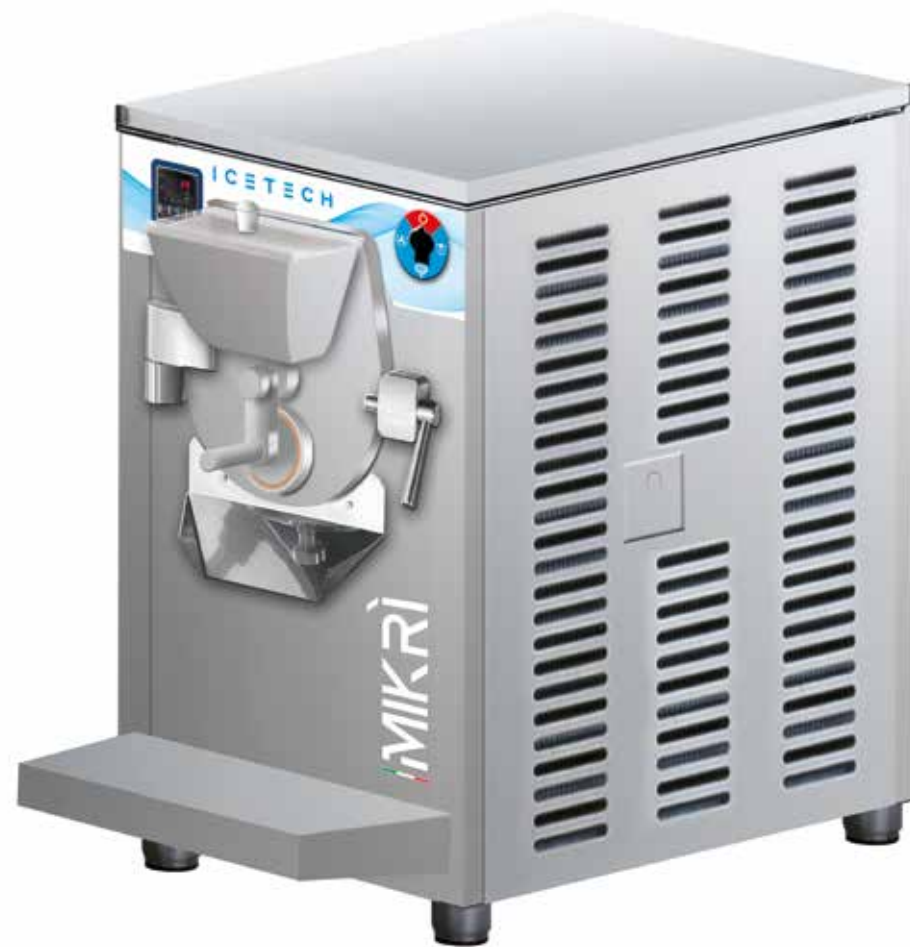
Commutatore Commutator Commuteur