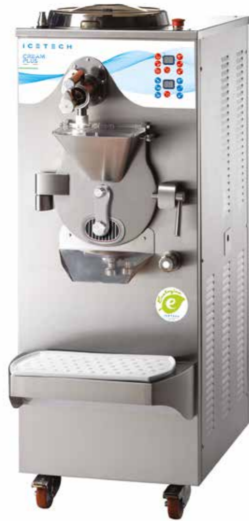
Sistema di agitazione Agitation system Système d'agitation