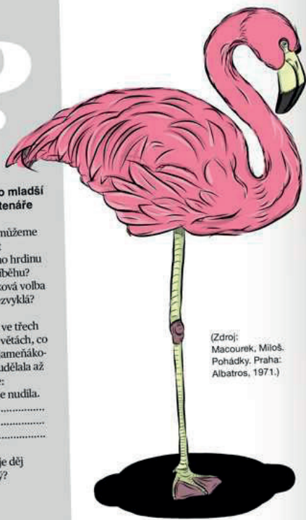
(Zdroj: Macourek, Miloš. Pohádky. Praha: Albatros, 1971.)