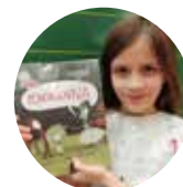
ROZÁRKA (2. TŘÍDA)

„Líbí se mi dílna čtení s tutori ze sedmé třídy, a když na začátku dílny čtení hrajeme různé hry. Bylo super, když jsme si na záda kreslili obrázky – tvary, abychom poznali, co by mohla hlavní postava cítit.“