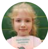
ROZÁRKA (2. TŘÍDA)

„Líbí se mi, že se tu nehodnotí. Je tu hodně aktivit a četby. Hodiny jsou takové volnější. Užívám si hodně čtení, zábavy, radosti, úspěchu.“