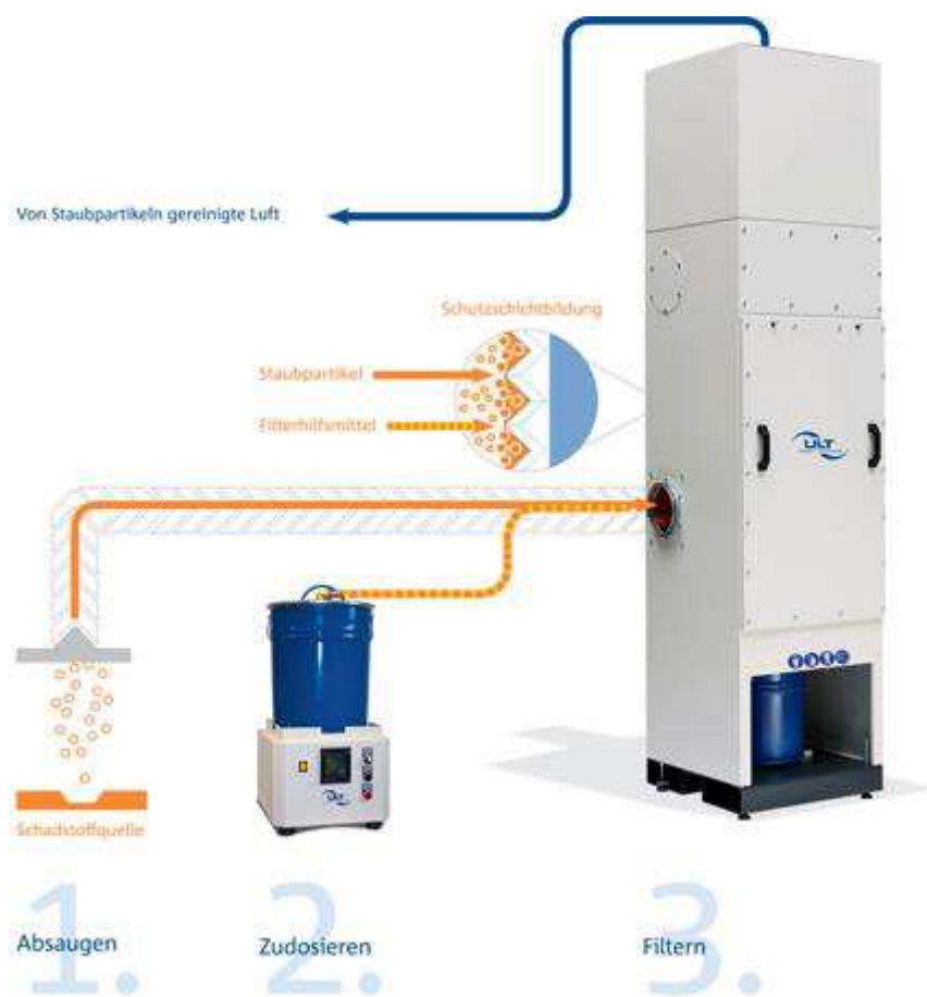
Bild: Zudosiereinheit zur Bindung und Filtration klebriger Stäube