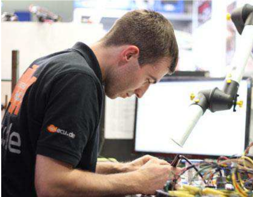
Bild 2: Absaugarm mit Erfassungselement zur Beseitigung von Lötrauch

der örtlichen Parameter und Einflüsse wie etwa Luftgeschwindigkeit der Emissionen oder Strömungsmechaniken eingesetzt, steigt der notwendige Erfassungsgrad bei minimalem Erfassungsluftstrom. 2