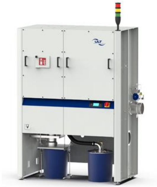
Abb. 4: Absaug- und Filteranlage LAS 800 für Laseremissionen

Staubgemische adaptiert werden. Dazu zählen unter anderem die Laserrauche aus ps-Anwendungen, aber auch Kunststoffabgase von Laserprozessen.