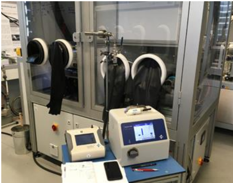
Abb. 1: Aufstellungsort der Messgeräte an der Laserschneidanlage

Abbildung 1 zeigt einen Messaufbau am Fraunhofer-Institut für Werkstoff- und Strahltechnik (IWS). Hier wurden Anoden aus Lithium durch den Laser konturiert. Aus Messdaten vom Konfektionieren von Lithiumanoden konnte nachgewiesen werden, dass der Abgasvolumenstrom die Elemente wie in Tabelle 1/Abbildung 2 gezeigt enthält.