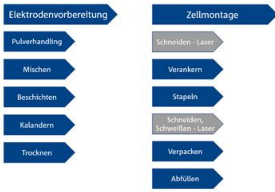
Abb. 6: Prozessschritte der Batteriezellfertigung

Besonders kritisch sind die in Abbildung 6 „Zellaufbau“ gezeigten Fertigungsschritte, für die es entscheidend ist, dass keine Feuchtigkeit mehr in die Zelle eindringen kann. Diese Schritte werden daher bevorzugt bei Raumluftfeuchten mit einem Taupunkt von kleiner -60^{\circ}\text{C} ( T_p ) durchgeführt. Auf diese Weise gelingt es auch, den zweiten negativ auf die Zuverlässigkeit einer Batteriezelle wirkenden Punkt der Luftfeuchte auszuschalten.