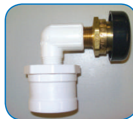
VÁLVULA DE ALIVIO