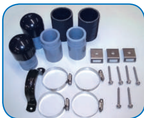
KIT DE CONEXIONES POR SISTEMA