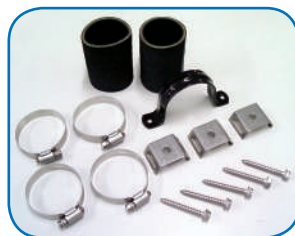
KIT DE CONEXIONES POR PANEL