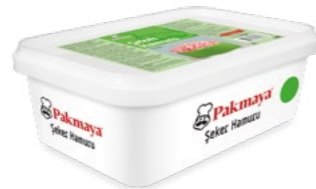
Şeker Hamuru Yeşil