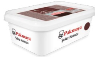
Şeker Hamuru Kahverengi