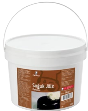
Soğuk Jöle Kakaolu