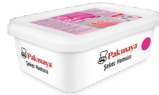
Şeker Hamuru Pembe