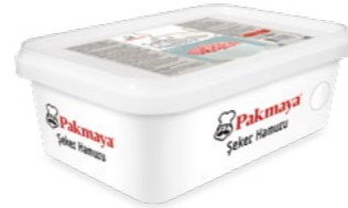
Şeker Hamuru Beyaz