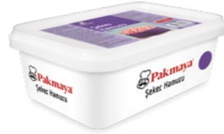
Şeker Hamuru Mor