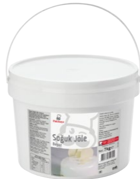
Soğuk Jöle Beyaz