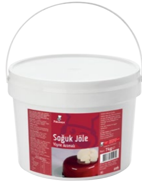
Soğuk Jöle Vişne Aromalı