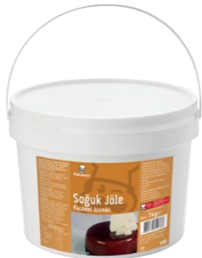
Soğuk Jöle Karamel Aromalı