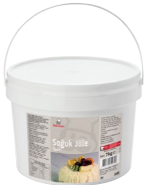
Soğuk Jöle Sade