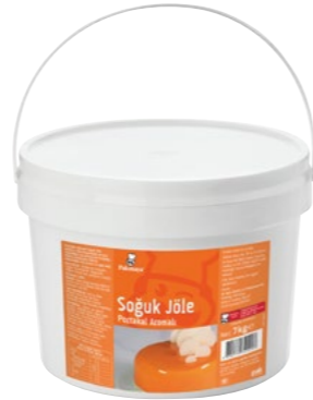
Soğuk Jöle Portakal Aromalı