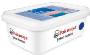
Şeker Hamuru Mavi