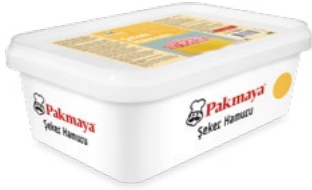
Şeker Hamuru Sarı

Gramaj : 1 kg Koli İçi Ağırlık : 1 kg x 6 Adet = 6 kg