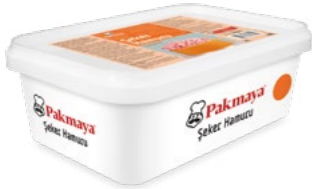
Şeker Hamuru Turuncu