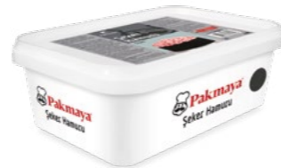
Şeker Hamuru Siyah