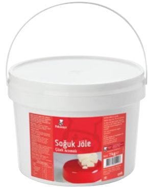
Soğuk Jöle Çilek Aromalı

Koli İçi Ağırlık : 7 kg x 2 Adet = 14 kg