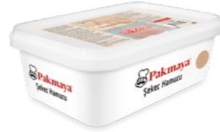
Şeker Hamuru Ten