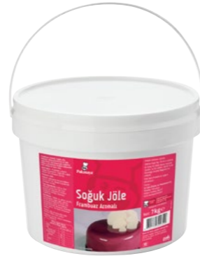
Soğuk Jöle Frambuaz Aromalı