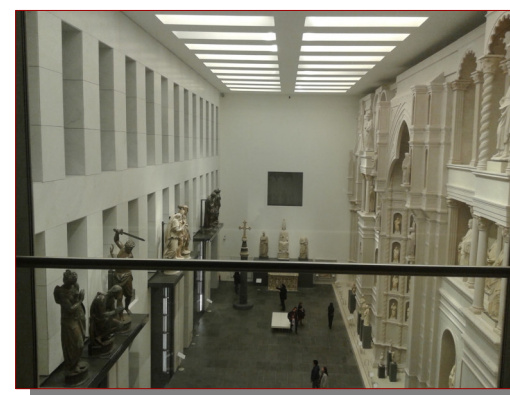
MUSEO DELL'OPERA DEL DUOMO FIRENZE