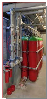
LABORATORIO IMPIANTO DI SPEGNIMENTO GAS INERTE PRATOVECCHIO