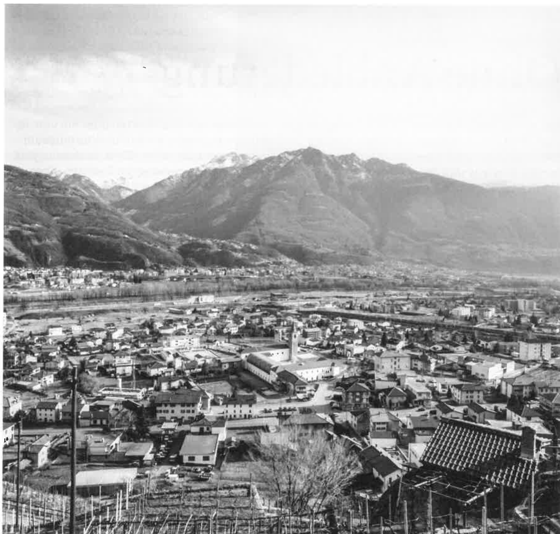
Vue sur Monte Carasso avec les principales interventions de Luigi Snozzi