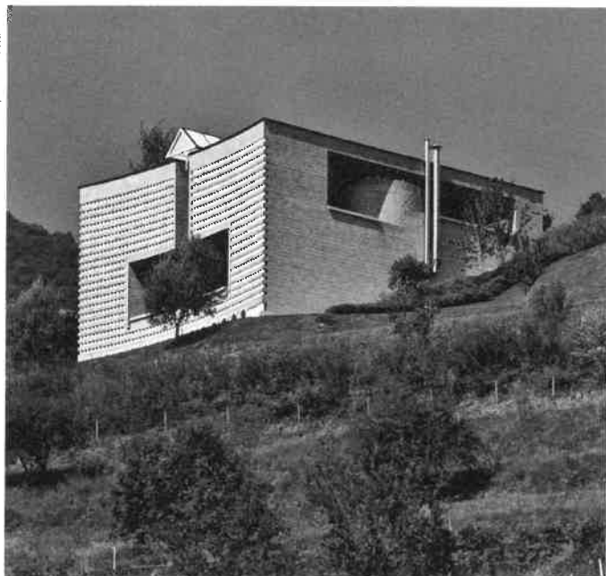
Mario Botta, Haus Pusterla, Morbio Superiore, 1982–1983