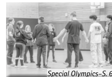
Special Olympics-S. 6