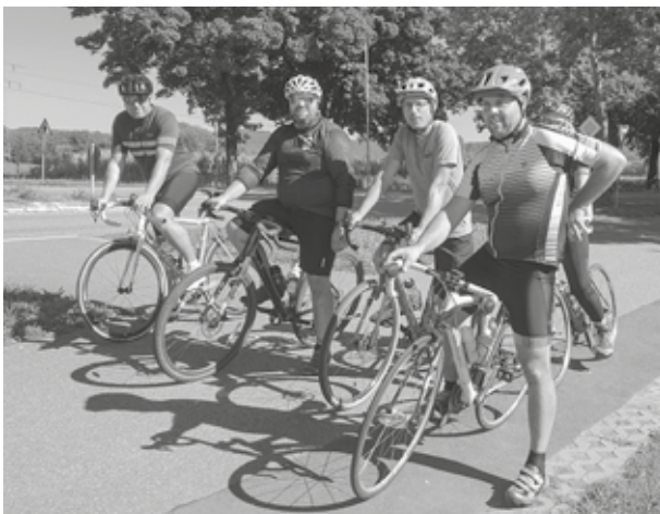
Feuerwehrkameraden aus Mietersheim vor dem 20 km Radfahren