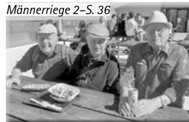
Männerriege 2-S. 36

Redaktionsschluss .....Nr. 1/2026 .....26. Februar 2026