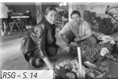
RSG - S. 14