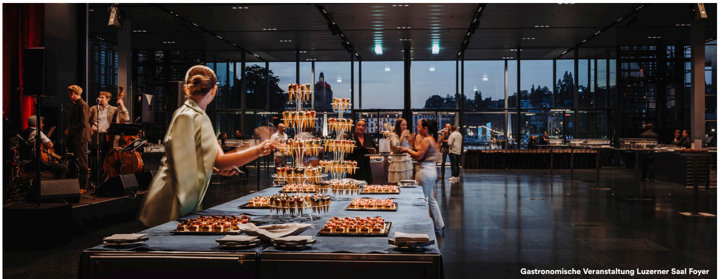
Gastronomische Veranstaltung Luzerner Saal Foyer