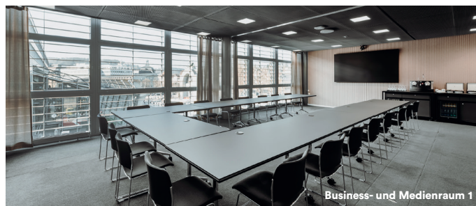
Business- und Medienraum 1