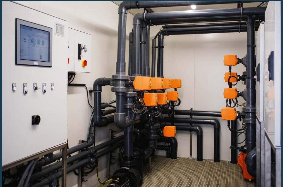
PUMPENSCHRANK MIT TOUCHSCREEN