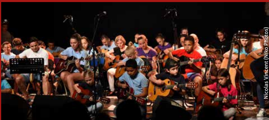
Nicolas Vincent (Niko Photos)