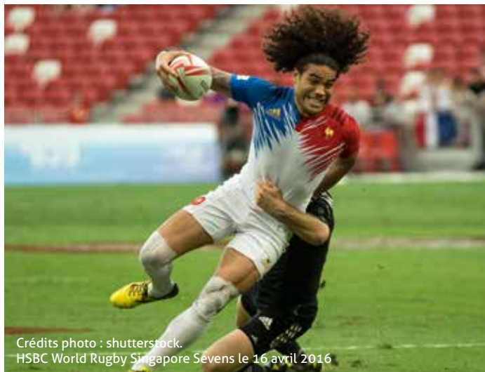
HSBC World Rugby Singapore Sevens le 16 avril 2016

Le samedi 17 février, la Ville de Dumbéa organise une matinée sportive et récréative sur la commune avec l'équipe de France de rugby à 7 !