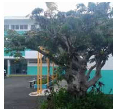
Nouveau carrelage et peinture extérieure à Alphonse-Dillenseger.