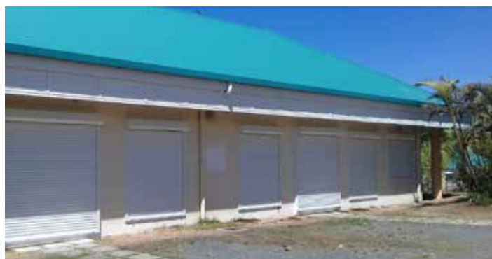
Installation d'ombrières et pose de volets roulants à l'école maternelle Les Jacarandas.