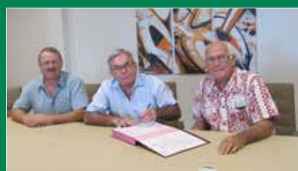
La signature des marchés a eu lieu mi-avril pour un montant global de près de 700 millions de francs.

une paire de baskets ou un vélo, le temps d'une balade.