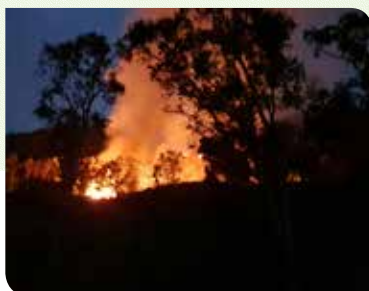
◀ FEU DE BROUSSE. D'importants moyens humains et matériels ont été mobilisés le 18 août pour venir à bout du feu de brousse qui s'est déclaré sur le secteur de Nondoué vers 15h. Entre 3 et 6 hectares ont été brûlés. L'action décisive des sapeurs-pompiers a permis de sauver des flammes une habitation.