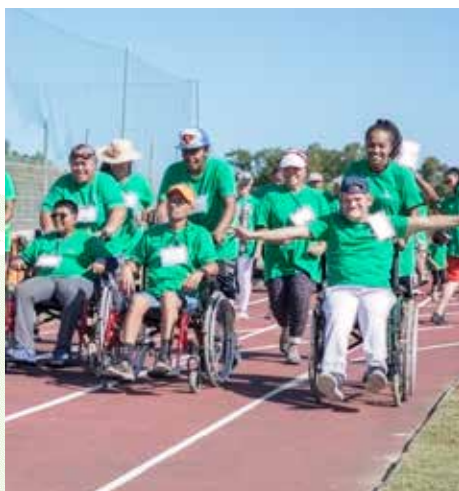
▲ SOLIDARITÉ. Initiée par l'Association Dumbéa Handicap, la première édition de « La course des heureux » s'est tenue le 18 août dernier au complexe sportif de Koutio en présence d'une centaine de participants.