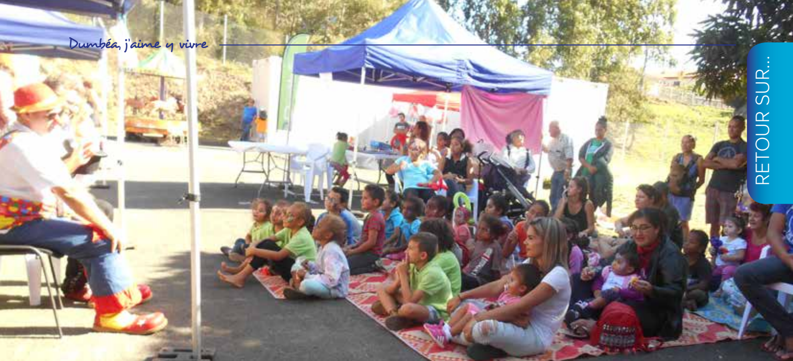
▲ PETITE ENFANCE. Au CCAS, le 11 juillet, 156 personnes ont participé à la Journée de la petite enfance et profité des nombreux stands d'informations pour les parents et d'animation pour les enfants.