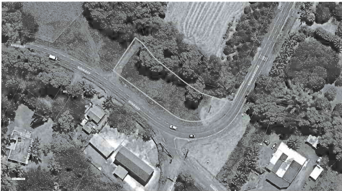
251, NIC 448227-1554, section KOE

Considérant qu'il convient, aux fins de prévenir un contentieux indemnitaire et tout litige à naître, d'établir une transaction, conformément aux articles 2044 à 2058 du Code Civil et vu l'article L 122-19 du Code des communes de Nouvelle-Calédonie,