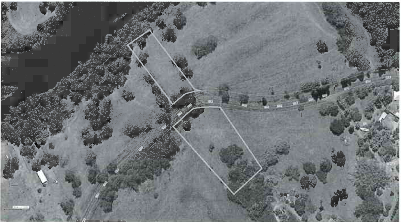
31, NIC 649548-3852, section NIMBA

Accusé de réception en préfecture 988-200012565-20221215-2022-418-DE Date de télétransmission : 26/12/2022 Date de récépissé : 26/12/2022 Date de dépôt en préfecture : 26/12/2022