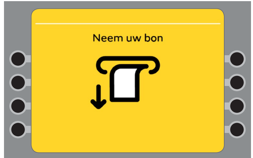
Uw bon is klaar. U kunt uw bon uit de automaat pakken.