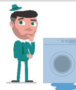
TABELA NR 3 – Limity - Pomoc DOM

10. Tabela nr 3 określa sytuacje, w których przysługują świadczenia assistance, oraz limity dla poszczególnych rodzajów świadczeń assistance.