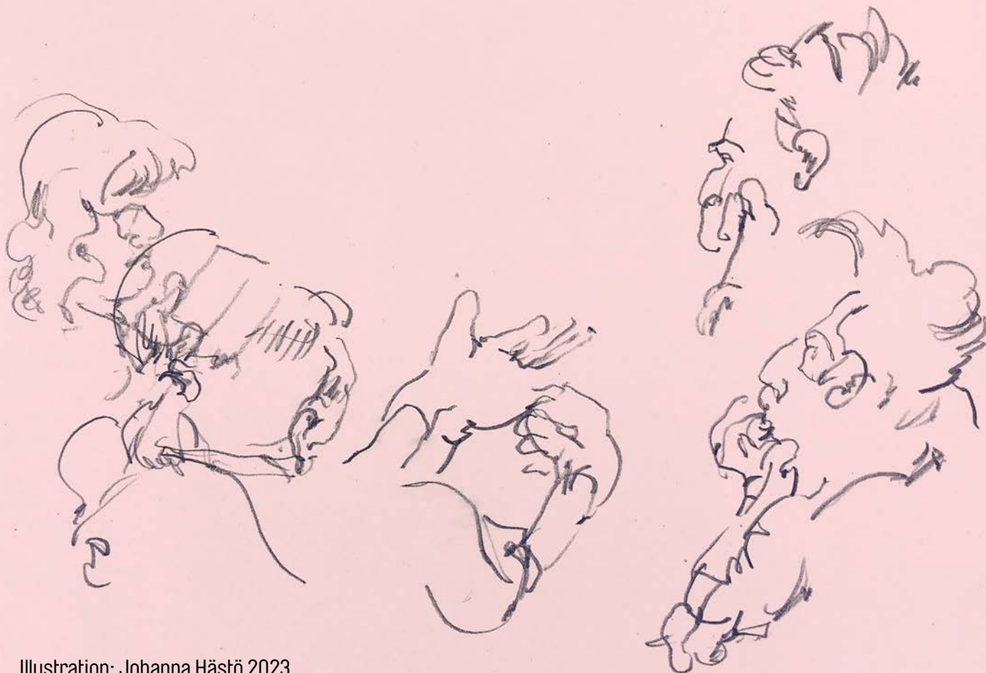
Illustration: Johanna Hästö 2023