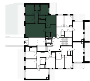
SCHEMA UMÍSTĚNÍ BYTU