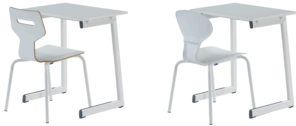
Gripz með Mix