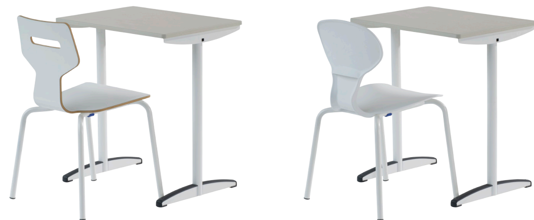
Gripz með Lesca