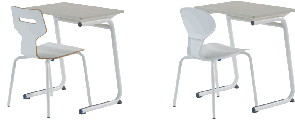
Gripz með Steady