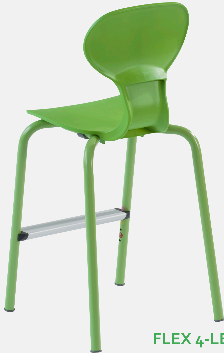
FLEX 4-LEG MEÐ PLASTSKEL