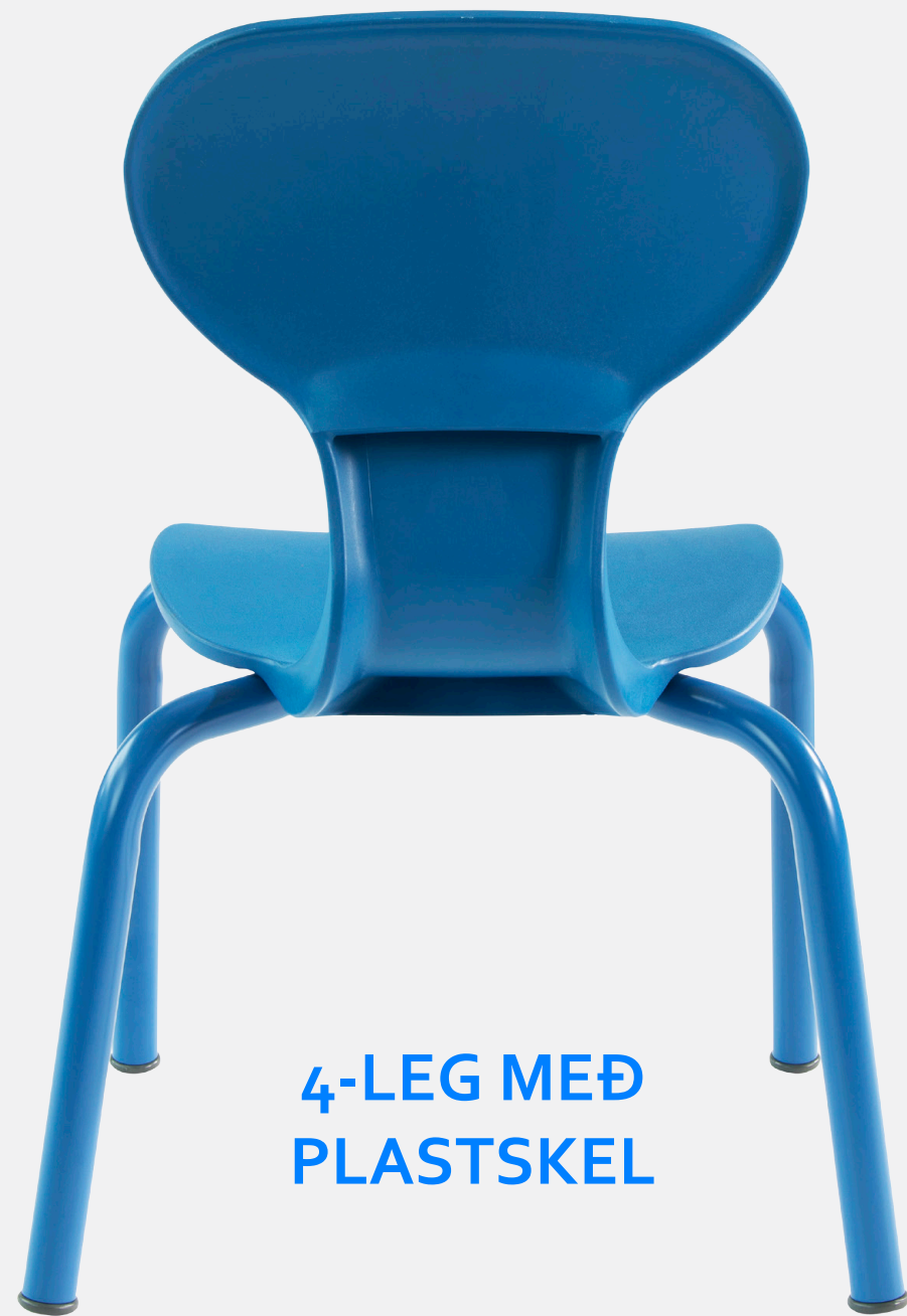
4-LEG MEÐ PLASTSKEL