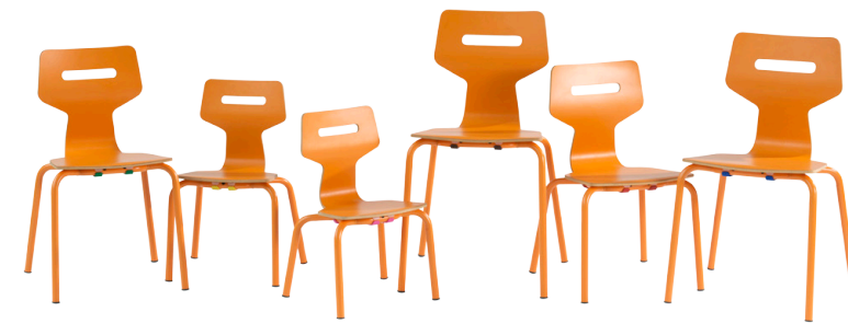
4-LEG MEÐ SÆTI ÚR TRÉ