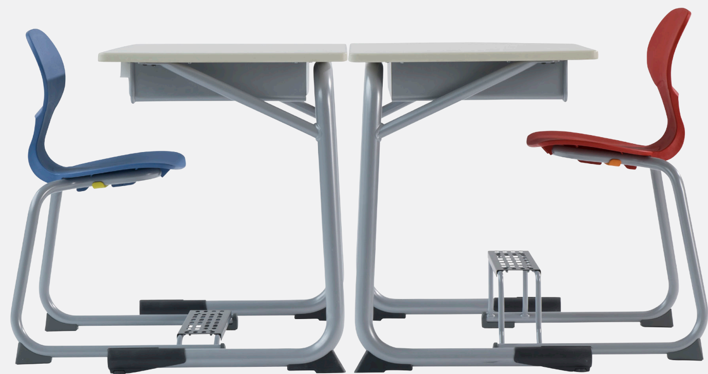
SAMA HÆÐ MEÐ GRIPZ EASY