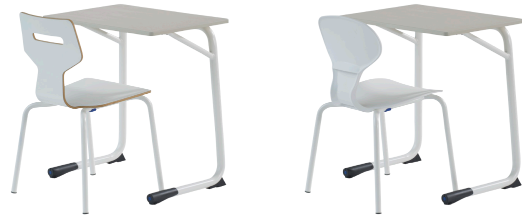
Gripz með Secundo