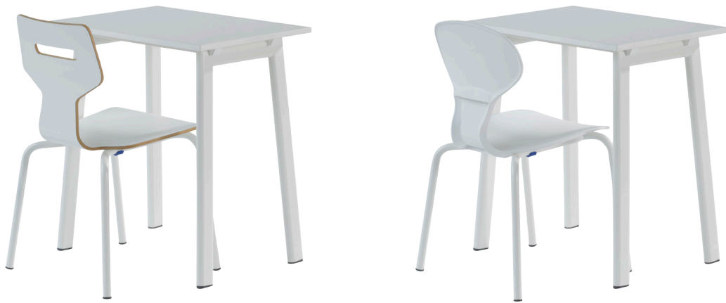
Gripz með Mix 4-leg