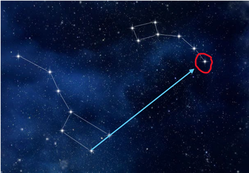
Figur 2 Karlsvognen og Lillebjørn

Når du har bevæget dig afsted på stjernekiggeri, vil det være oplagt at forsøge at finde flere forskellige stjernebilleder. Man kan fx i Astronomisk guide læse en masse om at observere stjerner på nattehimlen. På side 5, 7-10 og 12 er der illustrationer af stjernebilleder. Finde den astronomiske guide her: https://astronomisk.dk/wp-content/uploads/2014/11/AstronomiskGuide2012.pdf