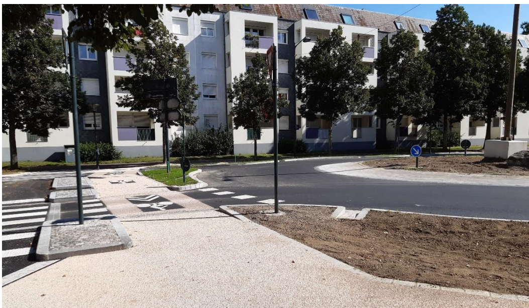
Giratoire Léon-Grimault / Pologne

Ainsi, l'aménagement définitif du giratoire des Gayeulles sera livré d'ici la fin du mois de septembre. Le giratoire qui relie le boulevard Léon-Grimault et l'avenue de Pologne a fait l'objet d'un aménagement des traversées cyclables et piétonnes durant le mois de juillet 2023. Le giratoire du Taillis à Cesson-Sévigné a été livré au début du mois d'août. De son côté, le giratoire qui relie le boulevard de Marbeuf, la rue Louis Guilloux et la rue de Saint-Brieuc va être finalisé dans les prochaines semaines.