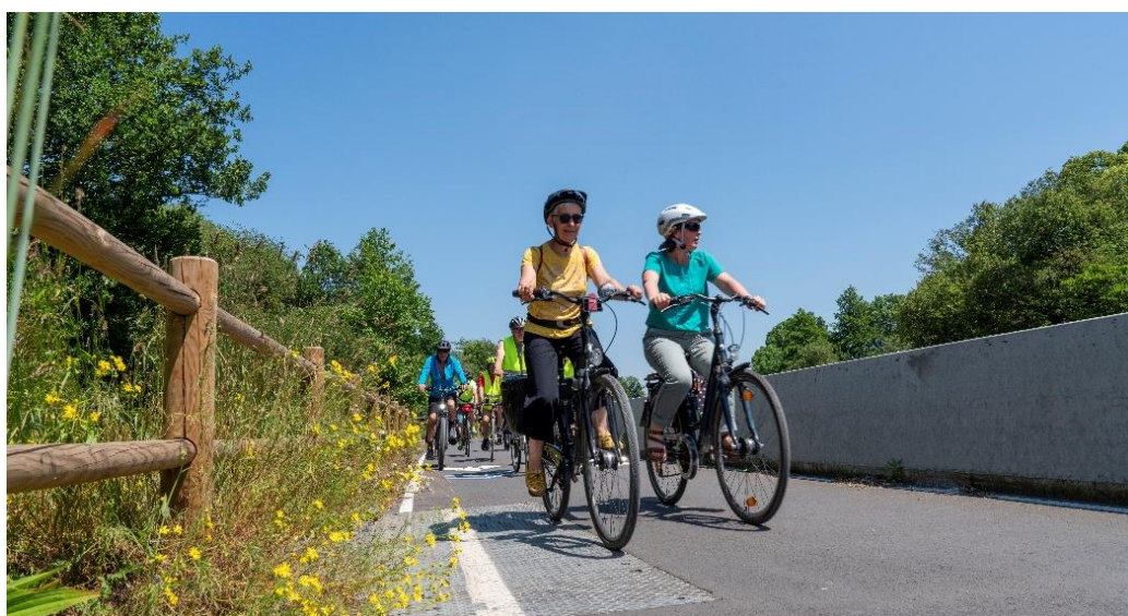
REV entre Rennes et Le Rheu