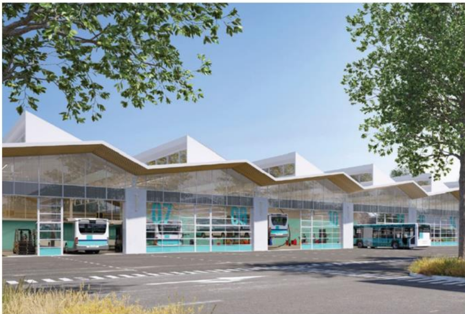
Façade ouest de l'atelier de maintenance – projet BLP & Associés