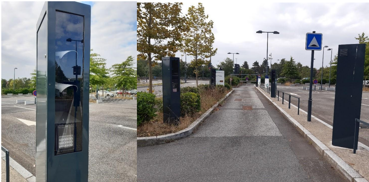
Système installé au P+r Les Préales

Ce nouveau système est possible grâce à la mise en place d'un système de caméras à l'entrée des parcs-relais qui permet de détecter automatiquement si la voiture est occupée par plus d'une personne. Ainsi, les covoitureurs ont l'assurance d'avoir une place, quel que soit le taux de remplissage du parc-relais.