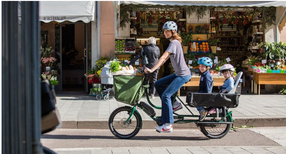
Exemple d'un modèle longtail

Il est également prévu l'achat de 25 longtails entre 2023 et 2024, également appelés vélos allongés, compacts et très adaptés pour les familles nombreuses puisqu'ils peuvent transporter jusqu' 3 enfants.