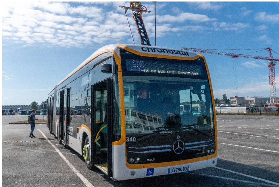
Bus électrique articulé avec pantographe relevé

L'éclairage intérieur est modulable. L'aménagement des bus permet d'améliorer les circulations à l'intérieur pour les passagers. 4 écrans équipent l'intérieur des bus. Le conducteur dispose d'un système de rétroviseur intégralement par caméras et de deux systèmes de sécurisation des autres usagers de la route : un système d'assistance au freinage en cas d'obstacle et un système de détection d'obstacle dans les angles morts.