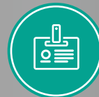
Karta firmowa (RFID)

Automat SaveRent jest zarządzany aplikacją kontrolującą również pozostałe jednostki IVM – SaveLog. SaveRent jest zatem kompatybilny z pozostałymi rozwiązaniami IVM podnoszącymi wydajność przedsiębiorstw.